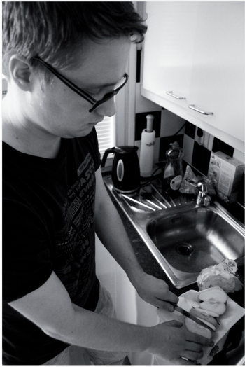
4. Först lite frukter...