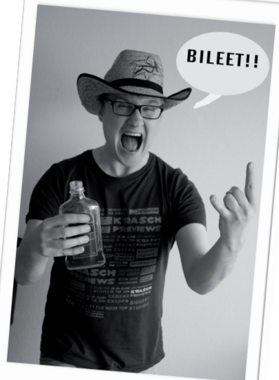
7. Festen kan börja igen!