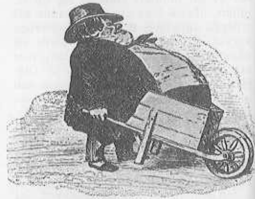
Enligt Goethe är stor lycka tung att bära — så ock äktenskaplig, tycker Bosco.