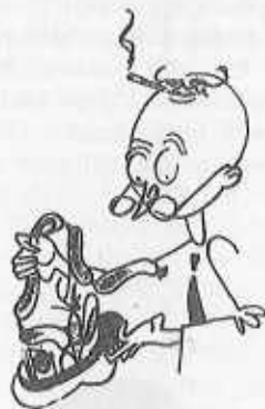
Snabb- eller spårvagnsfrukost.