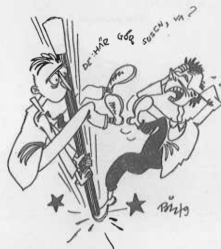
Klubb-bocken i järd med att utrota mag. Sandström.