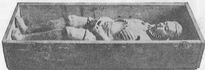
B-man firande sin potterabend

Till minusposterna ansåg civ. Collgren sig endast böra räkna den struntsumma på 2.000.000 varmed arkitekten i ett storvulet ögonblick ökat byggnadskostnaderna. Att målarskrået väntas strejka inom en snar framtid ansåg han endast verka stimulerande på de övriga arbetarna.