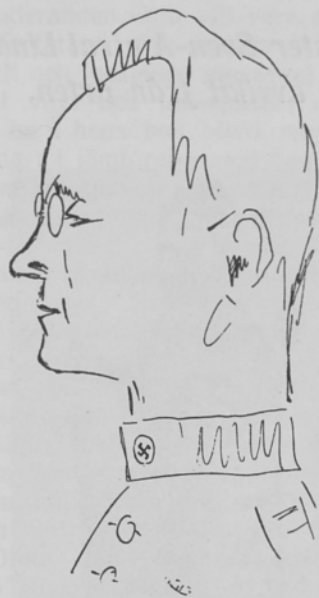
„Javisst — ja,“ vätske-beblandare.

Student A. Etablerad stultning på egna ben.