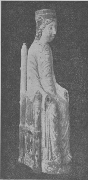
Madonna från Korpo.

Med tanke på våra energiska damer, dock ingen nämnd, understryka vi vår tillbörliga uppskattning av deras insats i kär livet genom att irföra bilden av ovanstående Madonna från Korpo .