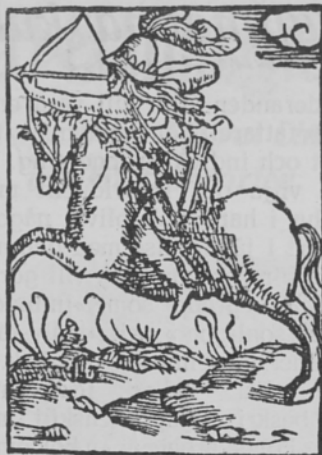
Kårens President, i hippologisk pose.

Förövrigt, det är ju bara rättvisan och sanningen, som på dessa blad komma i dagen. För följderna kan redaktionen icke svara. Och om någon stundom gjort sig skyldig till en lindrig förvrängning, eller en oskyldig överdrift, må detta vara henne tillgivnet, ty verkligheten blir vackrare, när den idealiseras. Dessutom är det ju VÅR, och VÅREN är kollerns tid, då kväkande, drillande och vrälände läten uppfylla den vaknande naturen med ett outhärdligt oväsen, medan kreaturer svärma omkring krälände, flygande och hoppande. Är det då underligt,