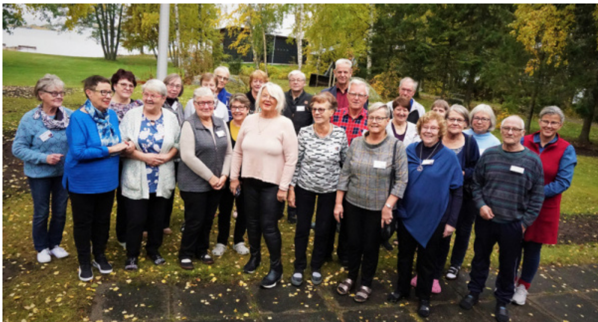
Erfarenhetsmentorer från Österbotten, på Alskat lägergård.