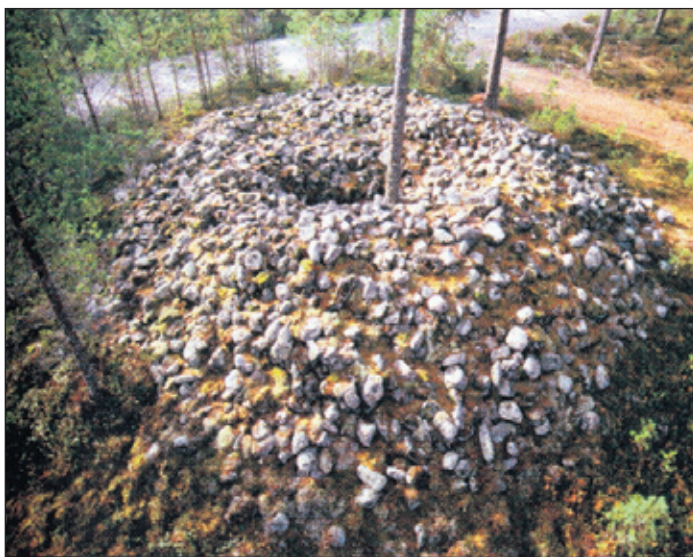
Forntiden kan vara vacker, fångad i form av de minnen den lämnat efter sig i landskapet. Bronsåldersröset finns på Stenringsbacken i Sideby.