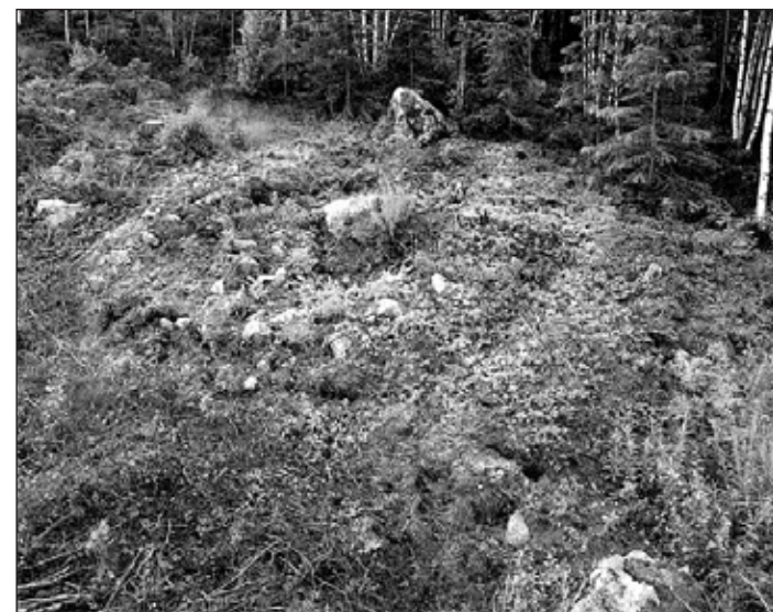
Den som fotograferar fornminnen har nytta av att betrakta dem ovanifrån. Cirkelstrukturen hos detta röse i Kimo syntes inte på marknivån.

objekten som man uppfattar dem i verkligheten, vilket låter lätt men inte är det: