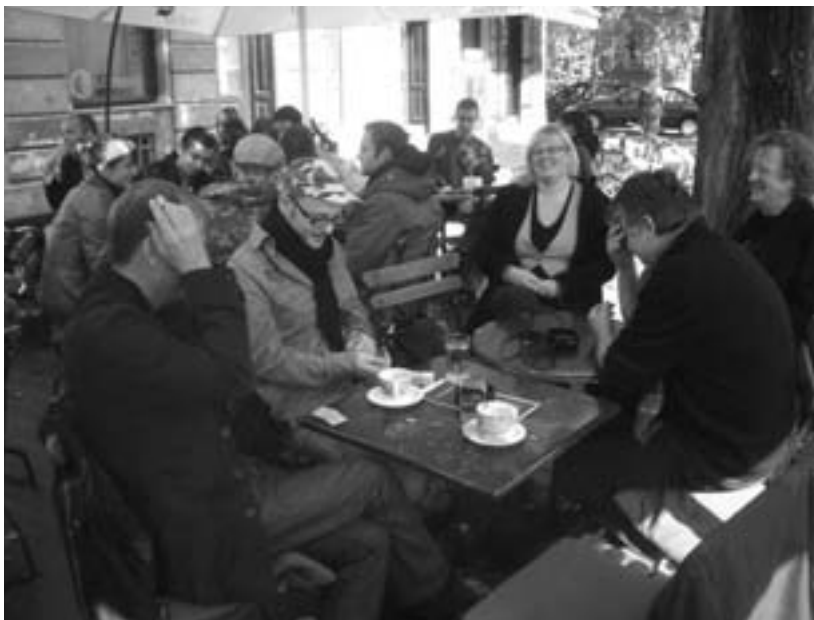
I NUROPE har man skapat ett internationellt nätverk av konstnärer, forskare och folk från samhälle och näringsliv. Bilden är liksom den till höger tagen i samband med NUROPE-konferensen i Istanbul januari 2008.

– Sedan starten har projektet kontinuerligt växt, nätverket har blivit mycket större och oaserna allt mer ambitiösa. Nyligen fick vi besked om att vi får stöd av Svenska Kulturfonden för ett par