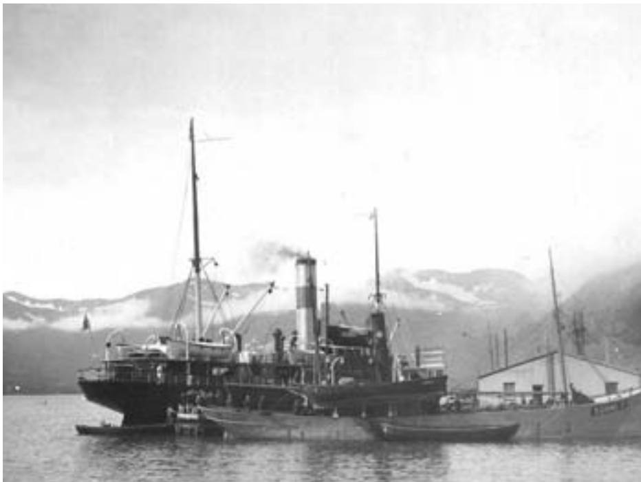
Nordströmrederiets fångstfartyg s/s Ruija. Bilden är sannolikt tagen i Linhammar, Petsamo 1931–33.

ridoren som gick från Polen genom Tyskland till Danzig.