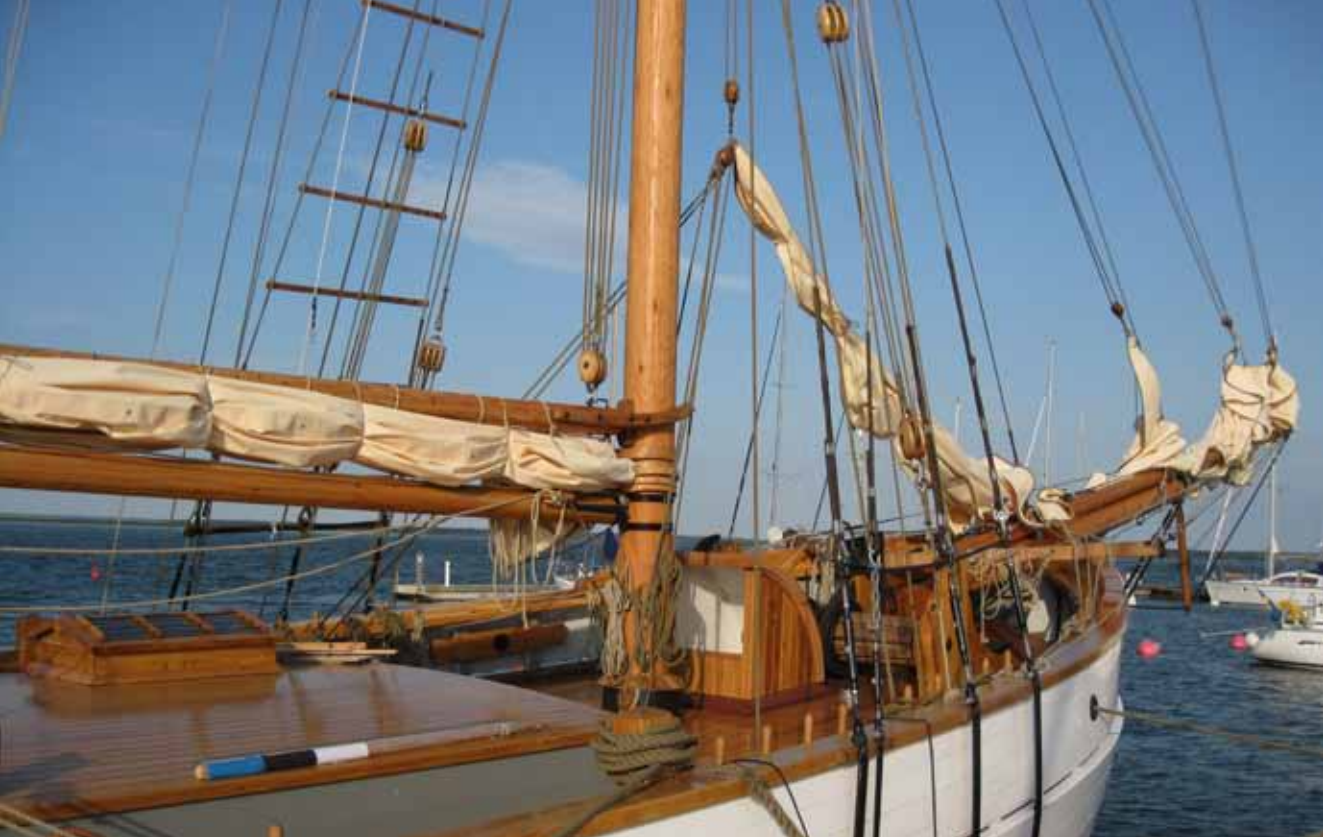
▲ Hoppet i sin hemmahamn i Hapsal, 13.9.2012.

VI PÅBÖRJADE en renovering av henne där på Beckholmen i Stockholm, men insåg småningom att det måste mera till än en renovering. Det måste bli ett nybygge för att det skulle kunna bli en skuta igen!