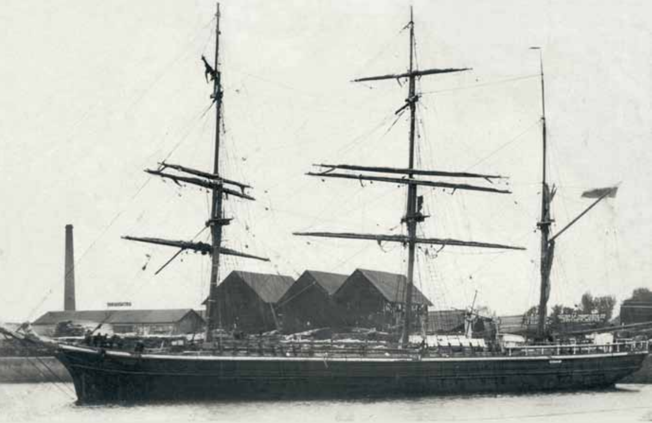
▲ Kings Lynn, juli 1909. Hoppet lossar trävaror lastade i Helsingfors där hon hade legat över vintern. (Foto: Privat samling).

Alla män och fler därtill hade behövts, visar fortsättningen i det gulnade brevet: "Skeppet fick ett stort hål i bogen och besättningen dämpa vattnet och stoppa hålet vad de kunde, med säckar och presenningar, samt lämpa barlasten akterut för att få fören att något höja sig."